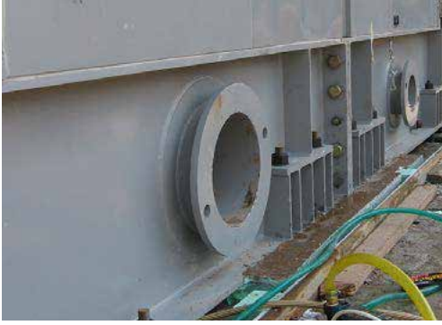
Şekil 1. Grout dökümünden önce türbin temelinin ankraj deliklerinde suya doyurma ve fazla suyu tahliye etme işlemleri

temiz olmalıdır. Ekipman yerleştirilmeli ve konumu ayarlanmalıdır. Ayar takozları (şimler) grout priz aldıktan sonra çıkartılacak ise, groutun yapışmaması için hafifçe yağlanmalıdır.