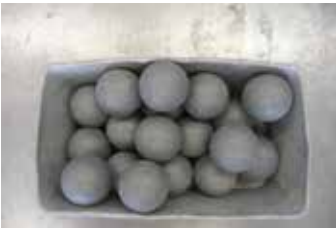
Şekil 2. Darbe için kullanılan çelik toplar