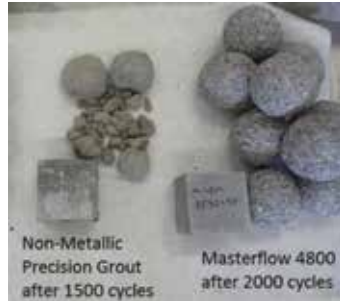
Şekil 3. 1500 ve 2000 çevrim sonrasında grout numuneleri.